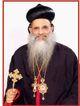
അഭി. പൗലോസ് മാർ മിലിത്തിയോസ് ദേശാഭിമാനി നിയുക്ത കാതോലിക്ക

വിസ്തൃതവും വിശാലവുമായ മലങ്കര ഓർത്തഡോക്സ് സഭയ്ക്കു സുസജ്ജമായ നേതൃത്വം നൽകുന്നതിനു ദൈവത്താൽ നിയോഗിതരായ ഏഴു വൈദിക ശ്രേഷ്ഠർ അഭിഷിക്തരായി. പ്രസ്നകലുഷിതമായ ദൂതകാലങ്ങളിൽ ശക്തമായ തീരുമാനങ്ങൾക്കും ഉറച്ച നിലപാടുകൾക്കും വേദിയായി തീർന്നിട്ടുള്ള മാർ ഏലിയാ കത്തിഡ്രൽ (എഡി സെമിനാരി) ഈ മഹത് ശുശ്രൂഷയ്ക്കു വേദിയായ് ദൈവോചിതം തന്നെ. യോഗ്യരായവരിൽ നിന്നു തിരഞ്ഞെടുത്ത പത്തുപേരായി തിരഞ്ഞെടുക്കപ്പെട്ടു, പുതുതായി അഭിഷിക്തരായ ഈ സപ്തർഷികൾ നാളിതുവരെ വ്യത്യസ്ത മേഖലകളിൽ സ്തുത്യർഹമായ സേവനം അനുഷ്ഠിച്ച് സഭാമക്കളുടെ ആരോഗ്യം അംഗീകാരത്തിനും പാത്രീഭൂതരായിട്ടുള്ളവരാണ്. യുവജന-വിദ്യാർഥി സമൂഹത്തിന്റെ സാധ്യതകളെ ഉൾക്കൊള്ളി പ്രവർത്തിക്കാൻ പര്യാപ്തരും ആശ്രമ, മിഷൻ പ്രവർത്തനങ്ങൾക്കു ശക്തമായ