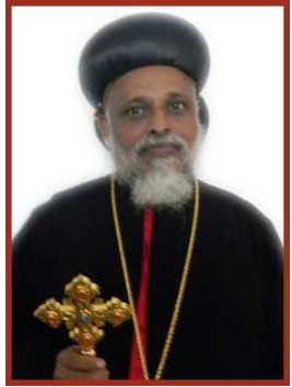
എല്ലാം നന്മയ്ക്കായി എന്നു കരുതുകയും ദൈവത്തിൽ ആശ്രയിക്കുകയും ചെയ്യുക എന്ന പാഠമാണ് ഇതുവരെ പഠിച്ചത്.