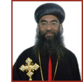
സദാംഗങ്ങളെ ആരാധനാ ജീവിതത്തിൽ കുറെക്കൂടി സജീവരാക്കുകയും, വിശ്വാസ-ആചാര-അനുഷ്ഠാനങ്ങളിൽ കൂടുതൽ നിഷ്ഠയുള്ളവരാക്കുകയും, അവരുടെ ആദ്ധ്യാത്മികവും ഭൗതികവുമായ വളർച്ചയ്ക്ക് സാധ്യമായ സൗകര്യങ്ങൾ ഒരുക്കുകയുമാണ് മുൻഗണനാക്രമമായി കാണുന്നത്.