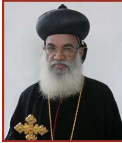
ദൗത്യനിർവ്വഹണത്തിൽ വിശ്വസ്തതയും, ആത്മാർത്ഥതയും, നിസ്വാർത്ഥതയും പുലർത്തി ദൈവകൃപയിൽ ആശ്രയിച്ച് മുന്നേറിയത് സന്തോഷവും സമാധാനവും സംജാതമാകുമെന്ന് കരുതുന്നു. അജപാലന ശുശ്രൂഷയിൽ അഞ്ച് കാറ്റഗോറികൾ മുൻഗണന നൽകാൻ ആഗ്രഹിക്കുന്നു.