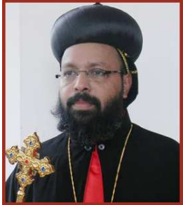
പരാജയങ്ങളെ ഫലപ്രദമായ ഉറവുകളും അദ്ധ്യാത്മിക അനുഭവങ്ങളും ആക്കി മാറ്റുക. പൗരസ്ത്യ ക്രൈസ്തവ പാരമ്പര്യവും ദാർശനിക ആദ്ധ്യാത്മിക പൈതൃകവും സമന്വയിപ്പിക്കുന്ന ജീവിത ദർശനം വളർത്തി മത തീവ്രവാദത്തിൽ നിന്ന് സമൂഹത്തെ രക്ഷിക്കുകയെന്നതാണ് സ്വപ്ന പദ്ധതി.