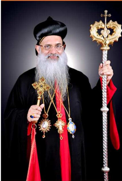
പരിശുദ്ധ ബസേലിയോസ് പൗലോസ് ഭിത്തിയൻ കാതോലിക്കാ ബാവ