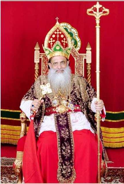
പരിശുദ്ധ ബസേലിയോസ് പൗലോസ് ദ്വിതീയൻ കാതോലിക്കാ ബാവ